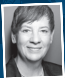
Dr. Barbara Hendricks Bundesbauministerin

Lassen Sie uns den Wohnungsbau-Tag nutzen, um uns über den weiteren Weg nach vorne auszutauschen.