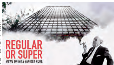
Plakat: Filmmuseum Düsseldorf

Die erste deutsche Siedlung auf dem Boden der heutigen USA geht auf 13 mennonitische Familien aus Krefeld zurück, die sich im 17. Jahrhundert in Pennsylvania niederließen. In wirtschaftlichen und politischen Krisenzeiten gingen auch zahlreiche Architekt*innen und Ingenieur*innen aus Europa in den Norden Amerikas, oft ohne zurückzukehren. Mit der aktuellen Staffel der Filmreihe „Wir bauen in den USA“ erzählen die Architektenkammer NRW und das Filmmuseum der Landeshauptstadt Düsseldorf Geschichten über die Architektur dieser Emigrant*innen. Von Johann Augustus Röbling im 19.