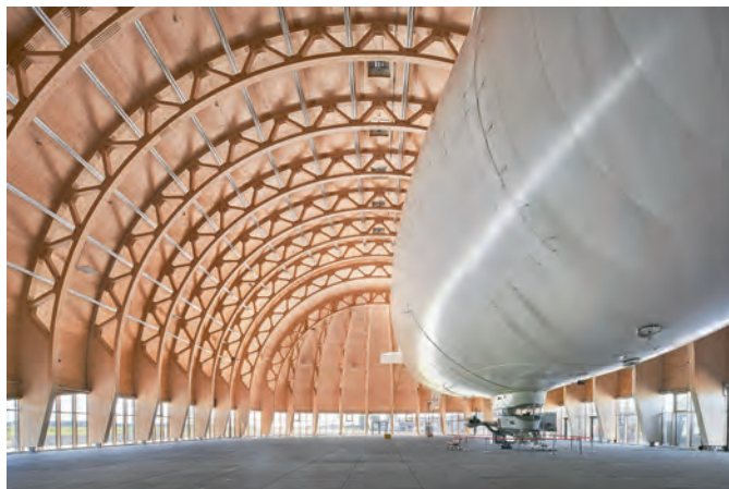
Beeindruckende, nachhaltige Architektur: Der neue Luftschiffhangar auf dem Flughafen Essen/Mülheim wurde als 2500stes Bauwerk aufgenommen.

etwa Details über den neuen Luftschiffhangar auf dem Flughafen Essen/Mülheim erfahren will, wird hier nicht nur über Größe und Konstruktionsweise, sondern auch über das nachhaltige Konzept mit dem konsequenten Einsatz von heimischem Holz und der Wiederverwendung des Abbruchmaterials des Vorgängerbaus informiert. Neben der Garagenfunktion für das Luftschiff „Theo“ werde der Hangar auch als Veranstaltungshalle für alle Arten von Events genutzt, erläutert der